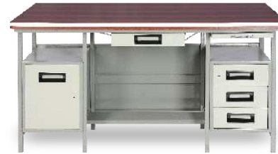
MODEL NO.: VI/T/120 EXECUTIVE TABLE Table having Right Side 3 Drawers & other side Cupboard Unit with Shelf, Center Drawer, Writing Pad & Back Panel with Nova Pan Top. Size : 60" x 36" x 30"