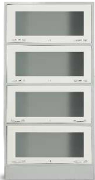
MODEL NO.: VI/BC/114 BOOK CASE Book Case with 4 glass Shutter. Size : 66" x 33" x 12"