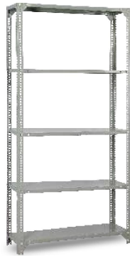
MODEL NO.: VI/R/117 RACK Slotted angle Rack with various size of Panel made of 1mm sheet.