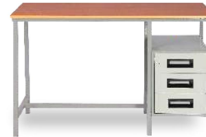
MODEL NO.: VI/T/118 SINGLE TABLE Table having 3 Drawers with Nova Pan Top. Size : 48" x 24" x 30" 36" x 24" x 30"