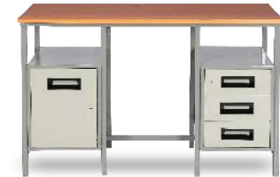
MODEL NO.: VI/T/119 DOUBLE TABLE Table having one side 3 drawers & other side cupboard unit with shelf with Nova Pan Top. Size : 48" x 24" x 30" 54" x 30" x 30"

Note : We also provide customized furniture according to your place & its measurements.