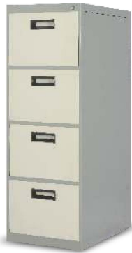
MODEL NO.: VI/FC/115 FILING CABINET Filing Cabinet having 4 Drawers (Note : also available in 2 & 3 drawers) Size : 54" x 27.5" x 18.5"